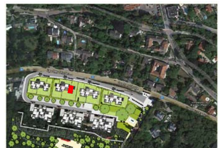
LAGEPLAN - genordet

Die in den Plänen vorhandenen Abmessungen sind nicht für die Bestellung von Einbaumöbeln verwendbar - Naturmaße nehmen erforderlich! Änderungen vorbehalten! Die Einrichtung ist illustrativ dargestellt, Ausstattung lt. gültiger BAB.